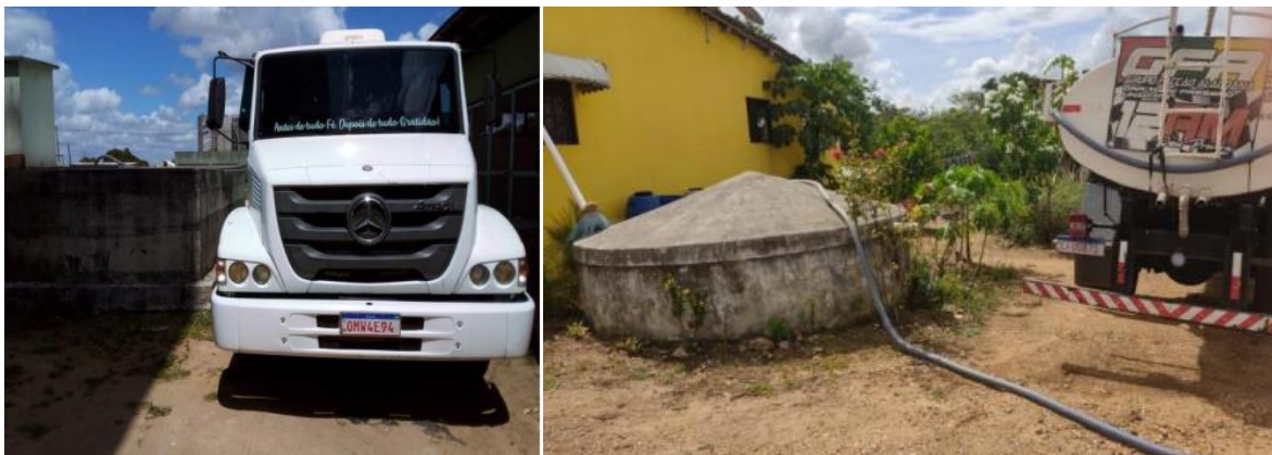
Figura 1. Serviço de transporte e abastecimento com caminhão-Pipa

Contratação de empresa especializada, pelo regime de contratação empreitada por preço global (conforme artigo 60, II, do regulamento interno de licitações, contratos e convênios da CASAL), para prestação de serviços de transporte e abastecimento de água por meio de 08 (oito) caminhões-Pipa, incluindo motoristas/operadores e combustível por conta da contratada, no período de 01 (um) ano. A contratação atenderá aos municípios das superintendências da Zona da Mata e Litoral (ZML) e do Agreste e Sertão (SAS).