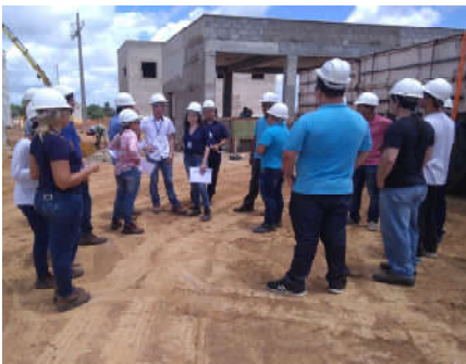
Visita à ETE do Benedito Bentes

A manhã foi encerrada com visita a um dos DMC's (Distritos de Medição e Controle de Perdas) do complexo habitacional Benedito Bentes. Já na parte da tarde, a visita continuou no Riacho Catolé, onde conheceram a ETA compacta do Sistema Aviação, que trata a água por filtração ascendente. As visitas foram encerradas no final da tarde, onde técnicos e estagiários compartilharam novas experiências agregando conhecimento para o futuro profissional.