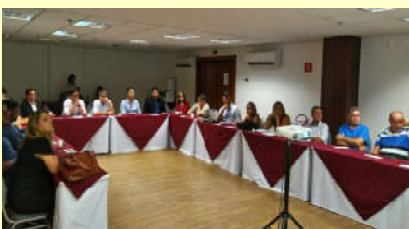
Empresários receberam orientações

A Companhia e a Prefeitura Municipal de Maceió promoveram, na manhã do dia 27, um encontro com diretores da Associação Brasileira de Bares e Restaurantes (Abrasel) e da Associação Brasileira da Indústria de Hotéis de Alagoas (Abih) para apresentar a Operação “Rede Limpa”. Na ocasião, eles receberam orientações sobre o que é,