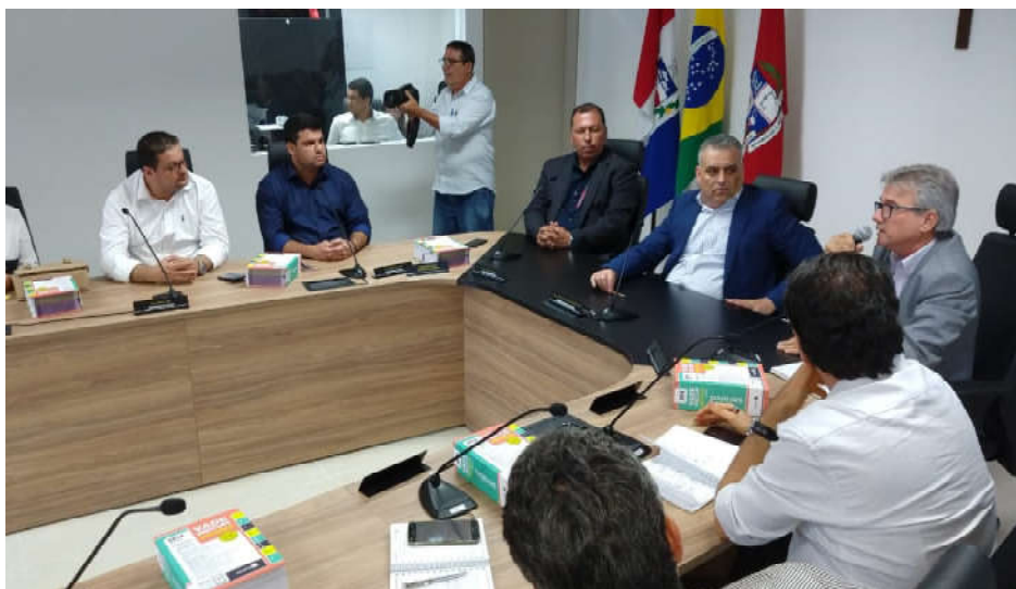
Em reunião na sede do MPE, em Maceió, presidente da Casal apresentou investimentos

Entre as dificuldades encontradas pela Casal e pela Agreste Saneamento para melhorar a produção de água para Arapiraca, estão a redução de vazão do Rio São Francisco, com o conseqüente assoreamento e distanciamento da água