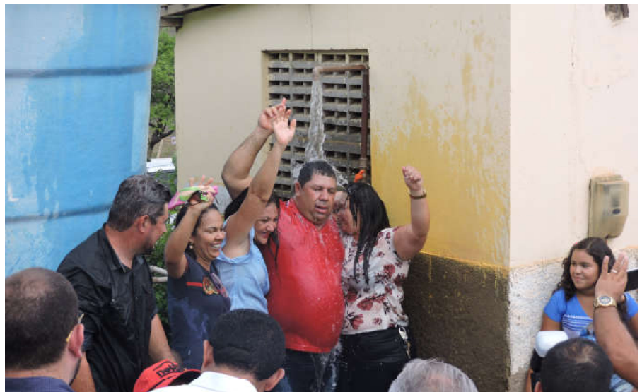
Prefeito, presidente, vice-presidentes da Casal e lideranças locais fizeram o descerramento da placa, discursaram e moradores comemoraram a inauguração