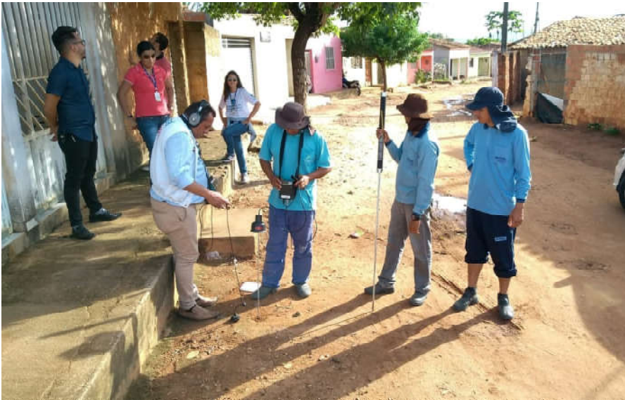
Treinamento prepara técnicos para identificar vazamentos e irregularidades no consumo