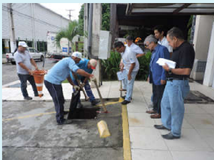
Caixa de gordura é vistoriada

A Casal e a Prefeitura de Maceió iniciaram uma nova fase da Operação Rede Limpa, cujo objetivo é vistoriar as caixas de gordura de bares e restaurantes da parte baixa de