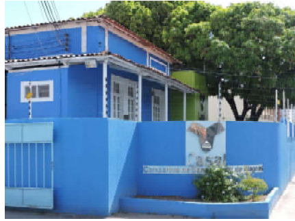
Prédio-sede da Casal em Maceió

Em virtude da recuperação dos últimos três anos, ele salientou que a empresa já