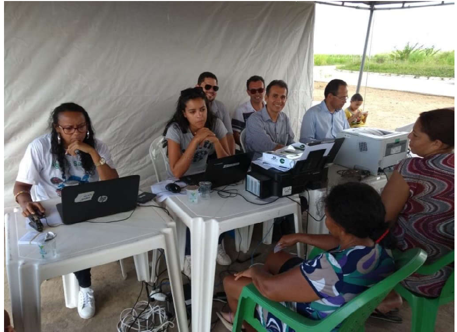
Ação itinerante em conjunto na Barra de São Miguel facilitou a vida de moradores

Já na Barra de São Miguel, a ação foi no Conjunto Alto da Barra, onde 120 usuários com vulnerabilidade social foram atendidos. Em Palmeira dos Índios, a ação foi no Conjunto Sebastiana Gaia, conseguindo atingir 190 imóveis.