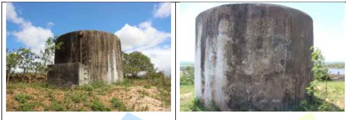
Fig. 02 – Reservatório de lavagem

A Estação Elevatória de Água Bruta requer várias melhorias para aperfeiçoamento de seu funcionamento e segurança dos operadores.