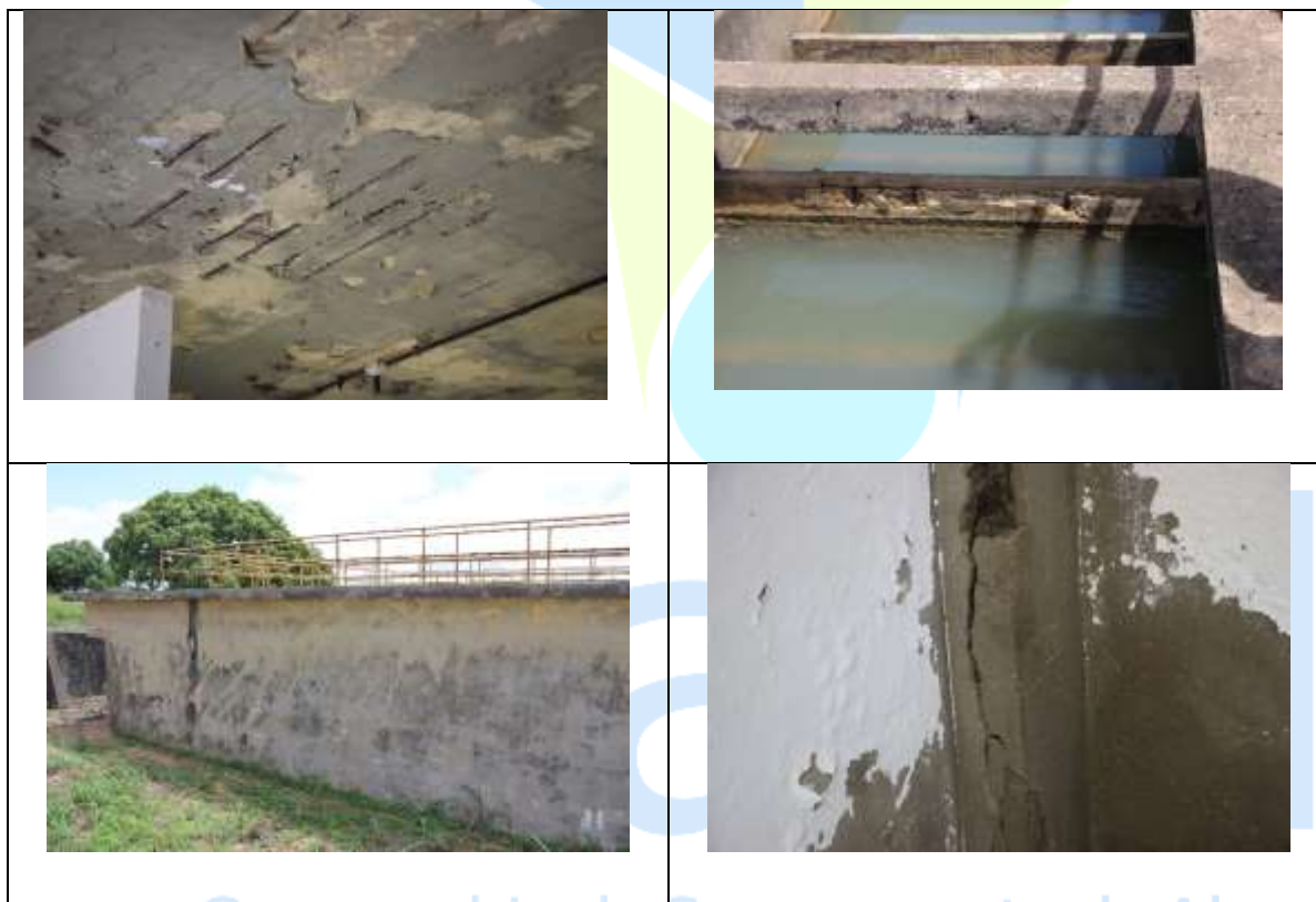
Figura 01 - Imagens da ETA

A ETA de JUNQUEIRO vem apresentando deterioração em seus elementos estruturais de concreto, nas lajes do primeiro pavimento, nas chicanas e paredes do tanque de floculação, conforme figuras abaixo; a grande perda de água na lavagem dos filtros, impõem a construção de um tanque de equalização e respectivo leito de secagem.