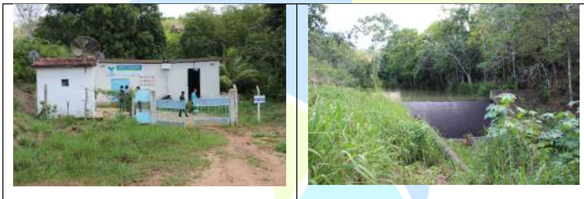
Figura 03 – EEAB e Barragem

A Estação Elevatória de Água Bruta requer várias melhorias para aperfeiçoamento de seu funcionamento e segurança dos operadores.