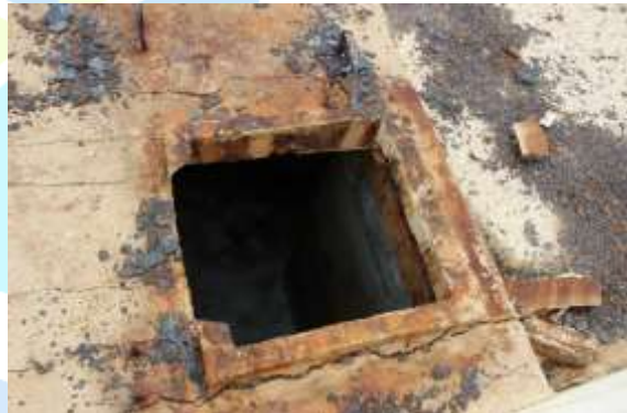
Figura 5. Concreto rompido na tampa de cobertura.