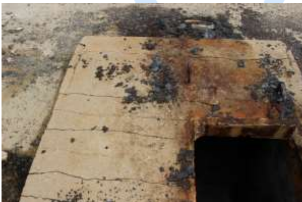
Figura 6. Tampa de ferro totalmente corroída.