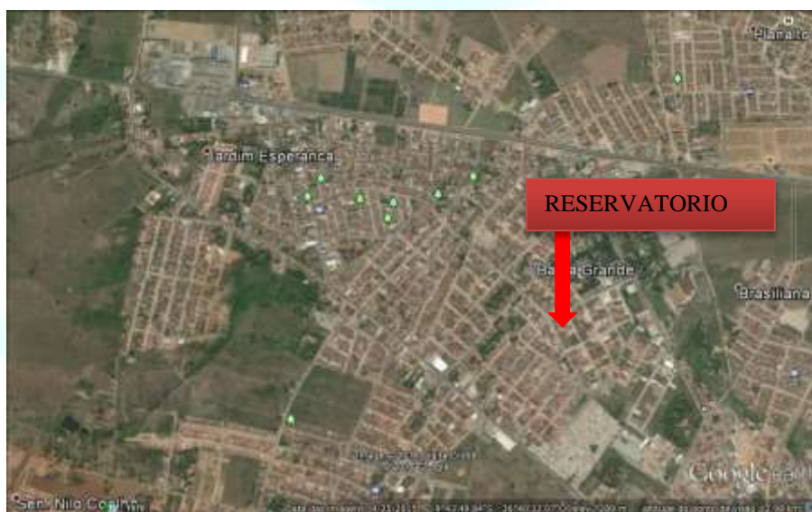
Figura 2. Localização do reservatório da Baixa Grande em Arapiraca