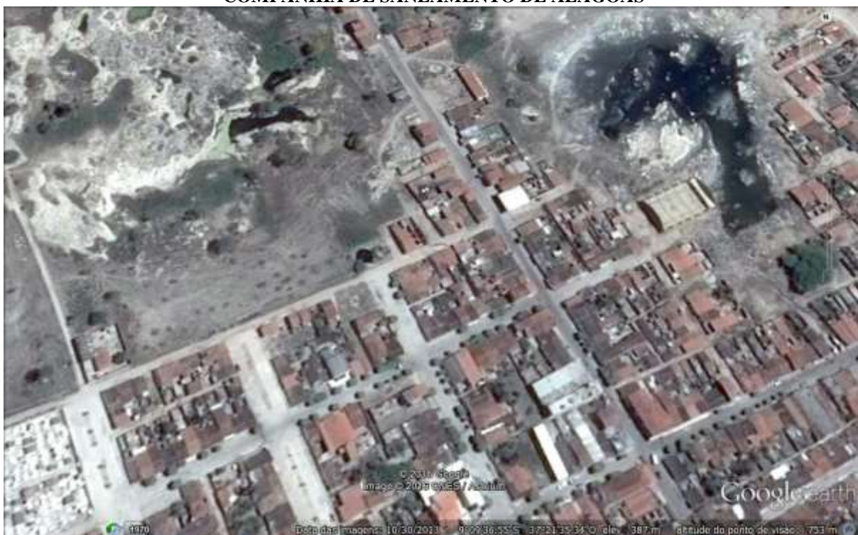
Figura 3. Localização do reservatório em Ouro Branco