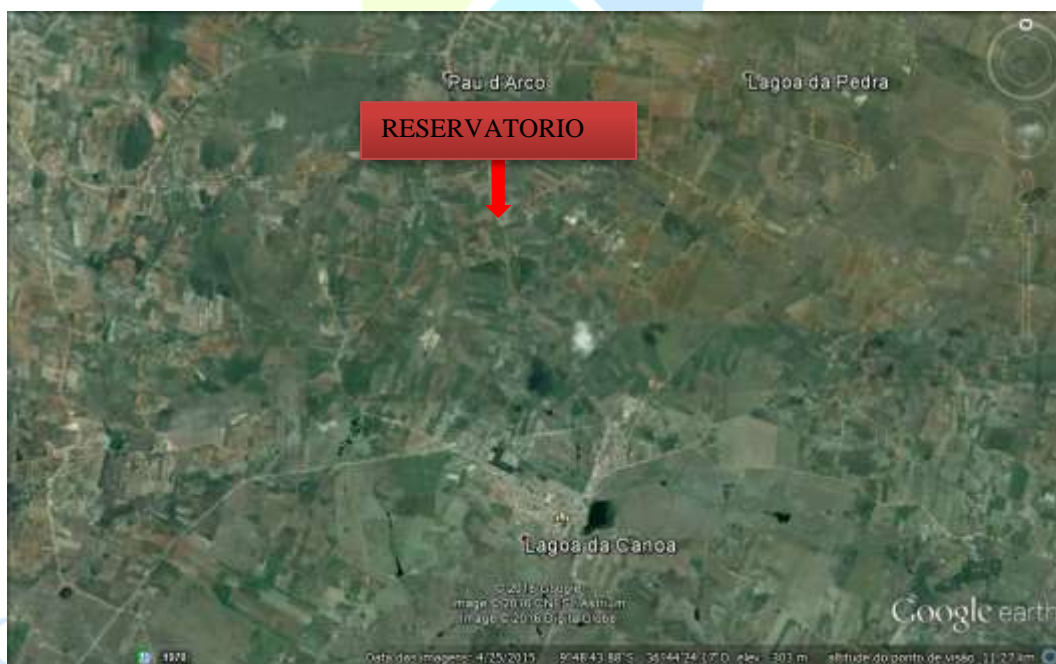
Figura 3. Localização do reservatório em Lagoa da Canoa

O reservatório é elevado com capacidade para 500.000 litros construídos em concreto armado sobre quatro pilares. O reservatório apresenta manchas e fissuras nas paredes e na laje de fundo aparecem manchas de oxidação da armadura, como podem ser visto nas figuras abaixo.