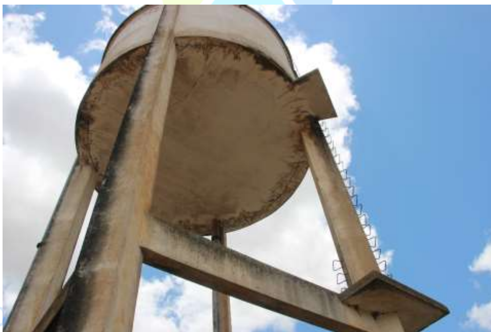
Figura 5. Laje de fundo do reservatório