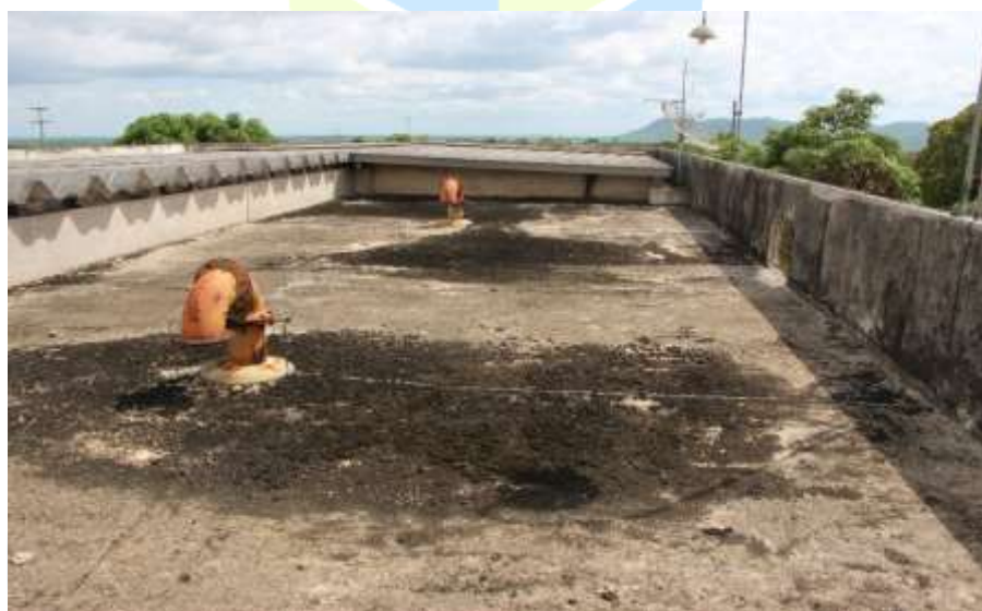
Figura 4. Laje superior do reservatório