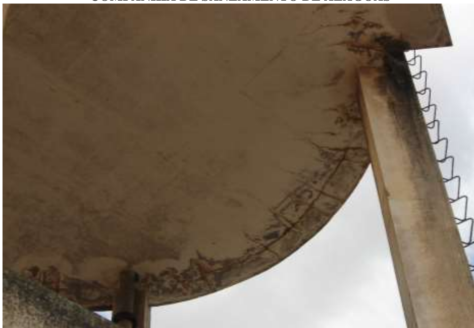
Figura 6. Manchas de oxidação da armadura.