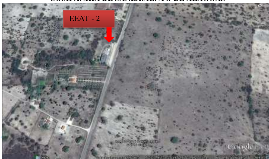
Figura 3. Localização da EEAT - 2 em Palestina