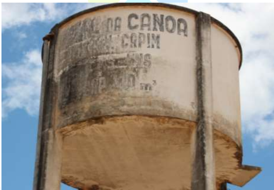
Figura 7. Manchas de carbonatação nas juntas de concretagem.

Pelas figuras é possível observar a existência de manchas nas paredes de concreto e manchas de oxidação na laje de fundo.