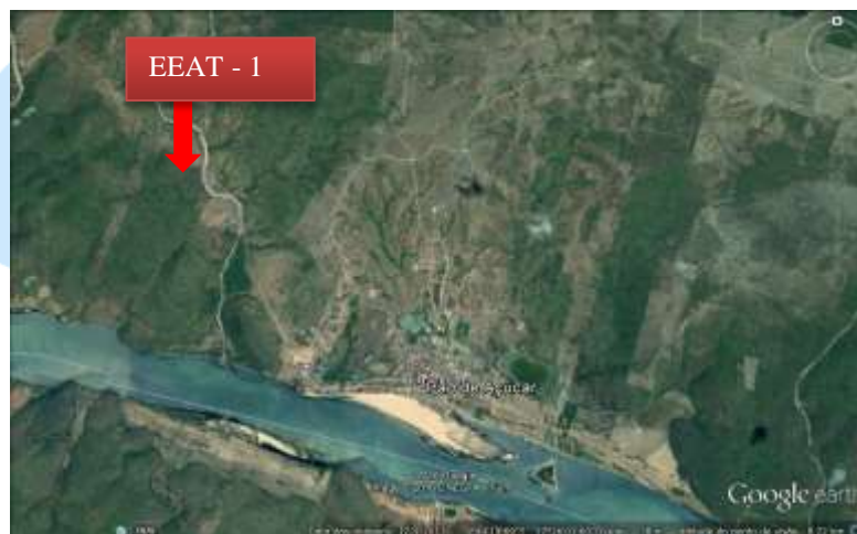
Figura 1. Localização da EEAT - 1 em Pão de Açúcar

Esta estação elevatória é parte integrante do SISTEMA DE ABASTECIMENTO da BACIA LEITEIRA visando o consumo humano, o que mostra a importância e a urgência de sua recuperação.