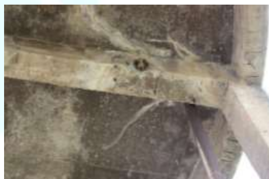
Figura 5. Armadura exposta nas vigas