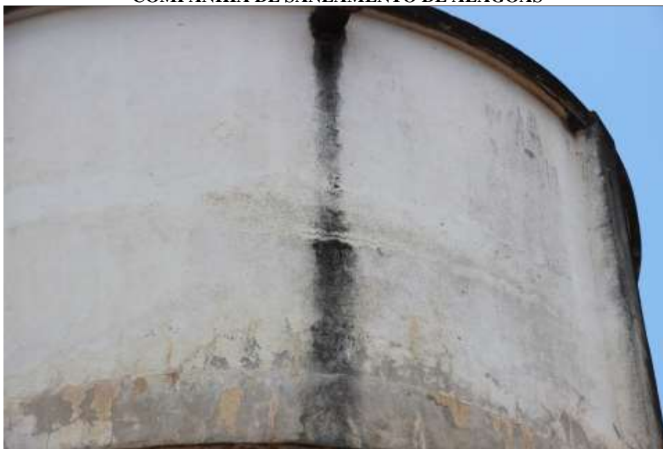
Figura 4. Fissuras na parede do reservatório