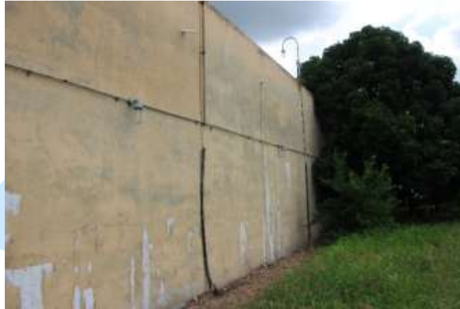
Figura 3. Vista da lateral do reservatório

Pelas figuras é possível observar a existência de fissuras nas paredes de concreto (Figuras 2 e 7) e fissuras e trincas na laje de cobertura (Figuras 4, 5 e 6).