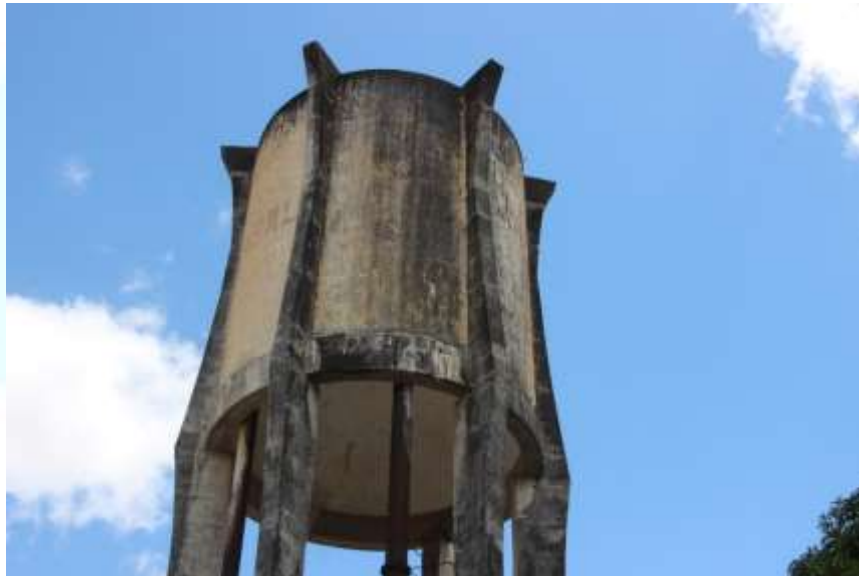
Figura 3. Vista do Reservatório com manchas de carbonatação.

O reservatório elevado situado no bairro da Baixa Grande com capacidade de 500.000 litros de armazenamento, para abastecimento humano dos bairros da Baixa Grande e adjacências, apresenta em seu corpo manchas de vazamentos.