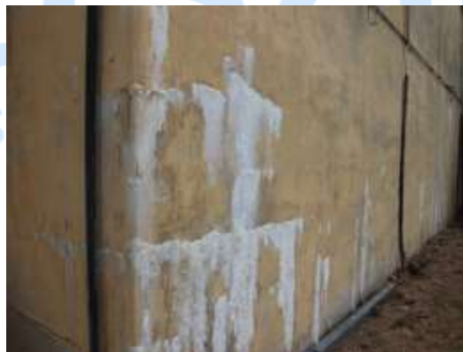
Figura 7. Fissuras nas paredes com vazamentos e carbonatação.