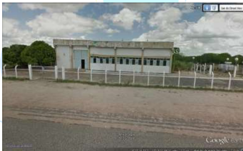
Figura 2. Vistas da EEAT 1 em Pão de Açúcar

O presente projeto é resultado de vistorias e inspeções realizadas para avaliações dos problemas estruturais e de vazamentos em reservatórios em concreto armado, localizados em Maceió e interior do estado de Alagoas, com o propósito de adotar metodologias de reparo, reforço e proteção dessas estruturas.