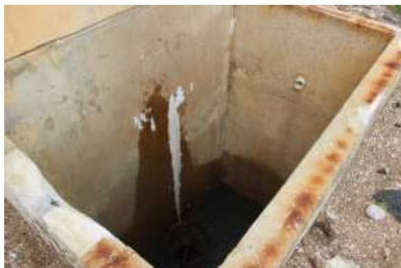
Figura 8. Fissura com vazamento e carbonatação.