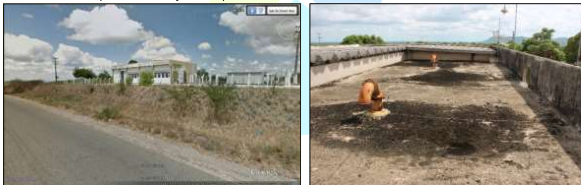
Figura 2. Vistas da EEAT – 2 em Palestina. Figura 2. Laje de cobertura do reservatório

O reservatório é composto por uma câmara com capacidade de 1100 m 3 de volume, com as seguintes dimensões, comprimento 18,75 m, largura de 7,60 m e altura de 8,00m. O reservatório apresenta manchas de carbonatação nas paredes externas devidas a vazamentos por descolamentos de mantas de impermeabilização nas paredes internas.