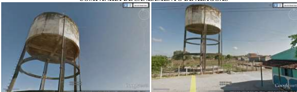
Figura 1. Vistas do reservatório de Ouro Branco