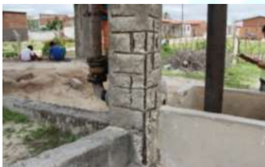
Figura 4. Armadura exposta nos pilares