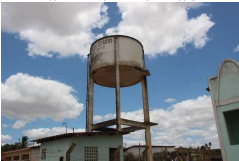
Figura 2. Vista do reservatório