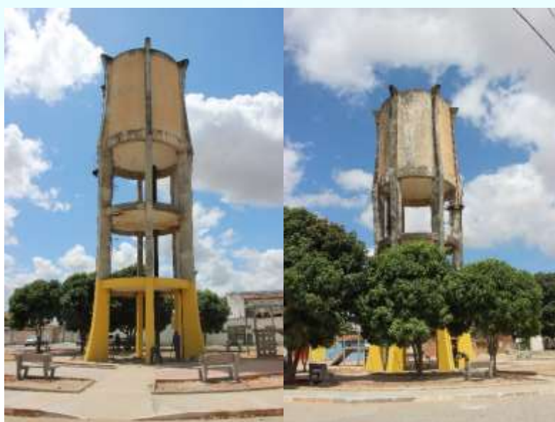
Figura 4. Vistas do reservatório.

O reservatório do bairro da Baixa Grande é parte integrante do sistema de abastecimento da cidade de ARAPIRACA visando o consumo humano (Figura 1).