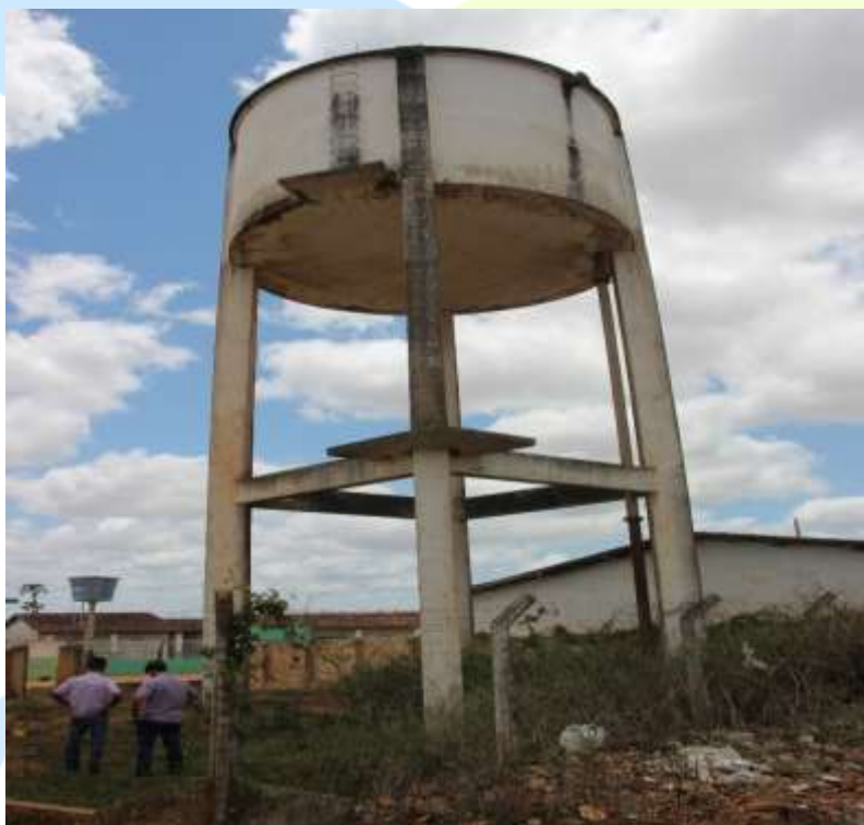
Figura 3. Vistas do reservatório de Lagoa da Canoa

O presente projeto é resultado de vistorias e inspeções realizadas para avaliações dos problemas estruturais e de vazamentos em reservatórios em concreto armado, localizados em Maceió e interior do estado de Alagoas, com o propósito de adotar metodologias de reparo, reforço e proteção dessas estruturas. Nesse contexto está inserido o reservatório elevado na cidade de Lagoa da Canoa (Figuras 1 e 2).