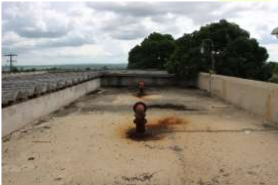
Figura 4. Laje do reservatório