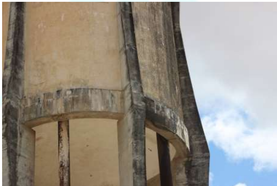
Figura 4. Manchas de carbonatação na parede e viga do reservatório

Pelas figuras 3 e 4 é possível observar a existência de vazamentos nas paredes, laje e vigas em função das manchas de carbonatação, o que evidencia a importância e a urgência de sua recuperação. Nesse caso, faz-se necessário o reparo no reservatório como medida corretiva e preventiva, mas também como importância estratégica para o sistema de abastecimento