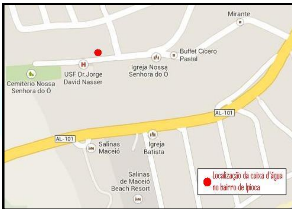
Figura 2: Mapa de localização da caixa d'água em Ipioca