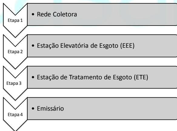
Figura 2 – Sistema de Esgotamento Sanitário