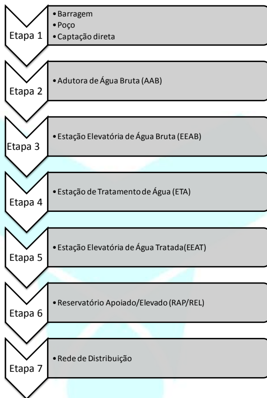
Figura 1 – Sistema de Água