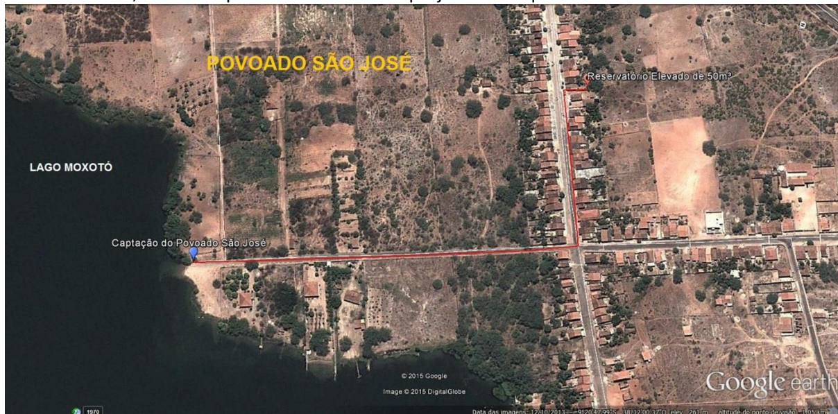
Figura 2 - Projeto da Adutora.

Nesse contexto, abaixo é apresentada a adutora projetada em questão.