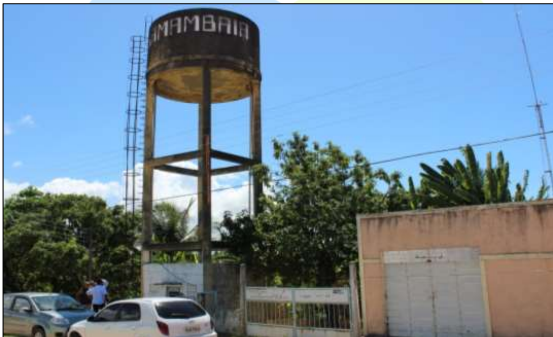
Figura 1. Reservatório do conjunto Samambaia.

Nesse contexto está inserido o reservatório do conjunto Samambaia (Figura 1), localizado no bairro da Serraria (Figura 2).