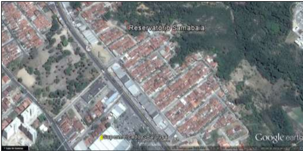
Figura 2. Localização do reservatório do conjunto Samambaia, no bairro da Serraria.

O reservatório, com capacidade de 30 m 3 , de 14m de altura e 4,60 de diâmetro, apresenta deterioração do concreto nos pilares e vigas, como podem ser vistos nas Figuras 3 e 4.