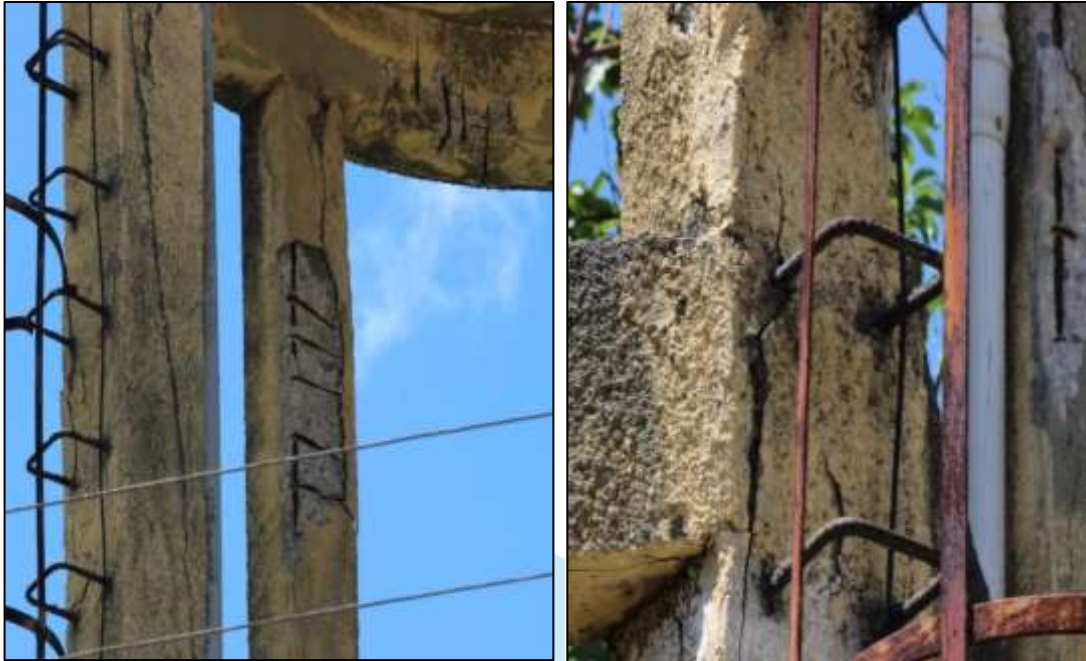
Figura 4. Deslocamento de concreto em vigas e pilares do reservatório.

O reservatório é utilizado para o abastecimento de água do bairro, visando o consumo humano, além de outras utilidades, o que mostra a importância e a urgência de recuperação dos vazamentos encontrados.