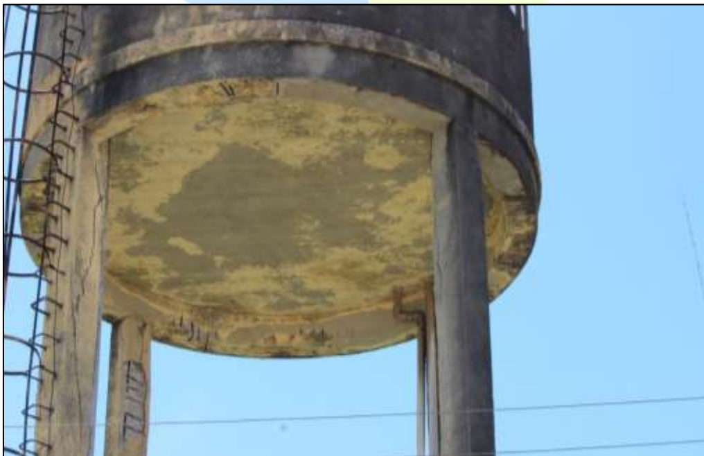
Figura 3. Deslocamento do concreto nos pilares do reservatório.

O reservatório, com capacidade de 30 m 3 , de 14m de altura e 4,60 de diâmetro, apresenta deterioração do concreto nos pilares e vigas, como podem ser vistos nas Figuras 3 e 4.