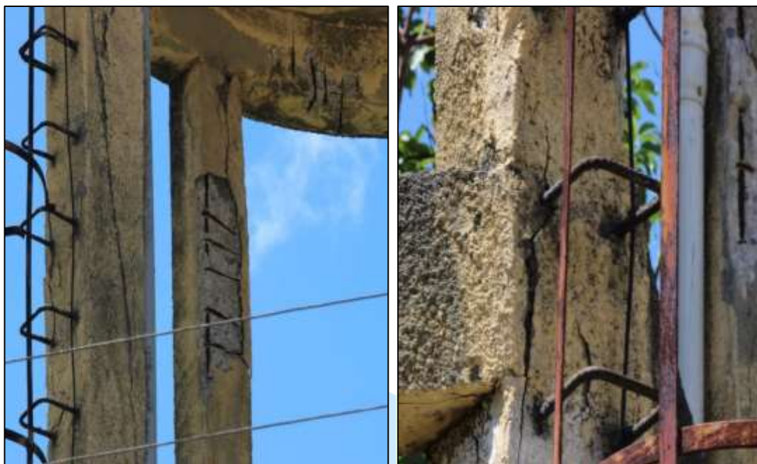
Figura 4. Deslocamento de concreto em vigas e pilares do reservatório.

O reservatório é utilizado para o abastecimento de água do bairro, visando o consumo humano, além de outras utilidades, o que mostra a importância e a urgência de recuperação dos vazamentos encontrados.