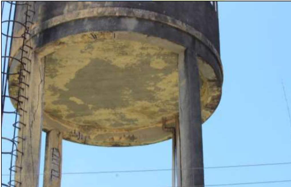
Figura 3. Deslocamento do concreto nos pilares do reservatório.

O reservatório, com capacidade de 30 m 3 , de 14m de altura e 4,60 de diâmetro, apresenta deterioração do concreto nos pilares e vigas, como podem ser vistos nas Figuras 3 e 4.