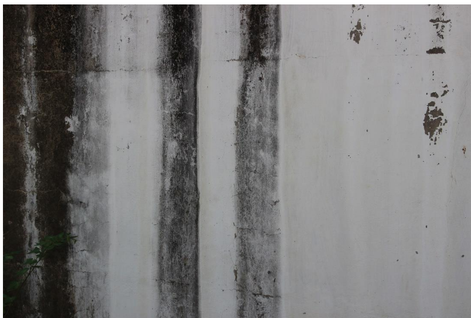
Figura 7 - Fissuras na parede

Pelas figuras é possível observar a existência de fissuras nas paredes de concreto e fissuras na laje de cobertura com a possibilidade de deslocamentos do concreto na face inferior com a probabilidade de exposição da armadura. Foram observadas também as manchas causadas por escoamento das águas pluviais devido ao sistema de drenagem da laje de cobertura.