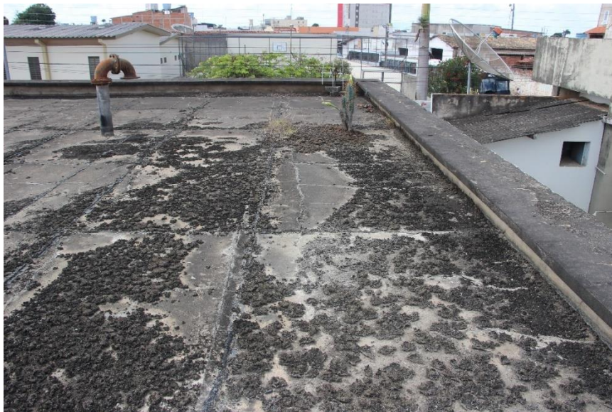
Figura 5 - Fissuras do concreto na laje