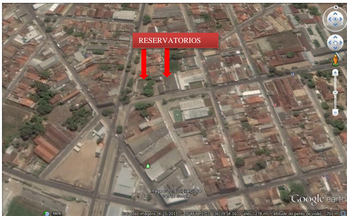
Figura 4 – Localização dos reservatórios do CRD 2

O CRD 2 é composto por dois reservatórios, um com capacidade de 1000 m 3 de volume, com dimensões de comprimento de 20,40m, largura de 18,95 e altura de 3,50 m, o outro com capacidade de 2000 m 3 , tem as seguintes dimensões, altura de 4,00 m, comprimento 29,10 m e largura de 18,70 m.