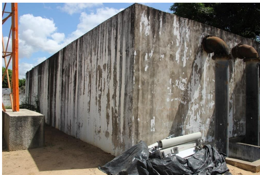
Figura 2 - Vista da lateral do reservatório