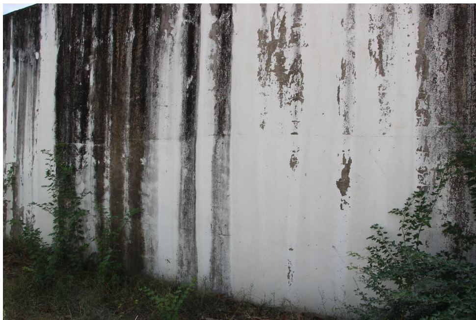
Figura - 6. Manchas nas paredes