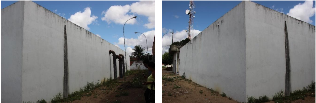
Figura 4 - Laterais do reservatório

Os reservatórios apresentam fissuras nas lajes de cobertura.