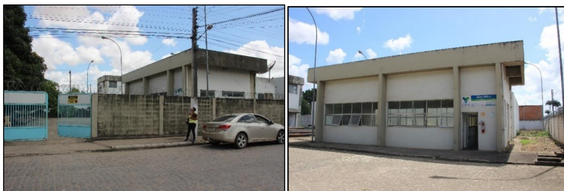
Figura 1 - Vistas do CRD-2

Nesse contexto estão inseridos os reservatórios apoiados do Centro de Reserva e Distribuição 02 (CRD - 02) na cidade de Arapiraca (Figuras 1, 2 e 3).