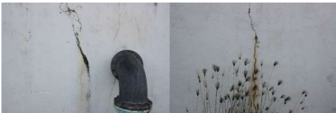
Figura 7. Fissuras nas paredes do reservatório apoiado.