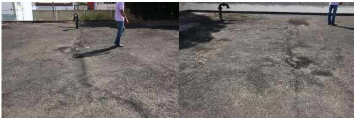
Figura 5. Fissuras na laje (tampa) do reservatório apoiado

laje de coberta com exposição de armadura. O reservatório elevado apresenta fissuras nas paredes e na laje de fundo, além de também apresentar deslocamento do concreto de recobrimento em vigas, pilares e laje de fundo.