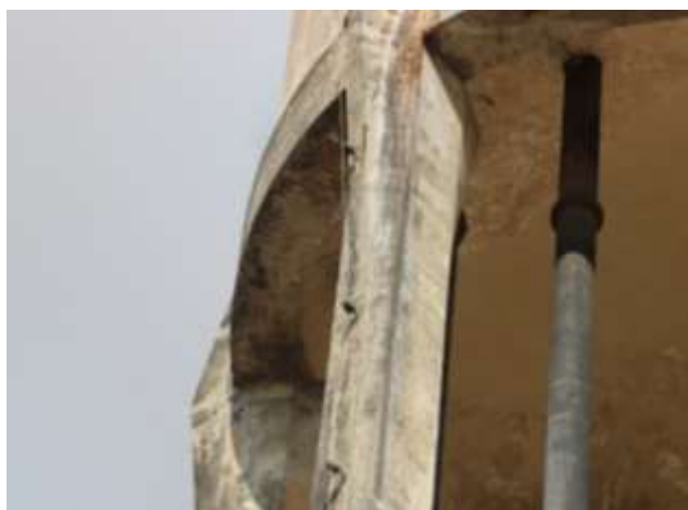
Figura 9. Exposição da armadura na viga do reservatório elevado.

Pelas figuras é possível observar a existência de fissuras nas paredes de concreto dos reservatórios apoiados. Foram observadas também as manchas causadas por vazamentos (Figuras 8 e 9), ocorridos possivelmente pelas fissuras ao longo das paredes externas do reservatório.