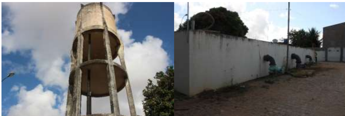
Figura 2. Vistas dos reservatórios