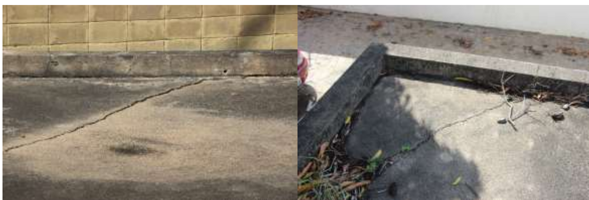
Figura 6. Trincas do concreto na laje de coberta (tampa).