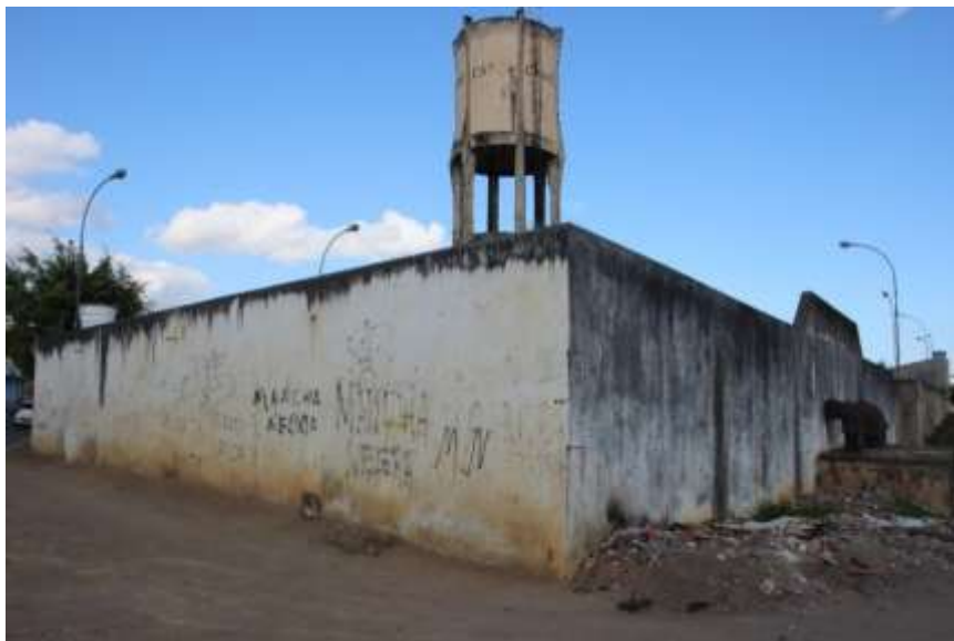
Figura 1. Vistas dos reservatórios de Arapiraca.