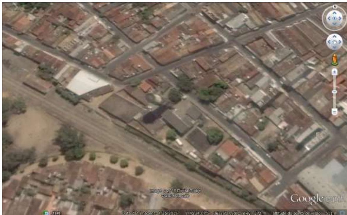
Figura 4. Localização dos reservatórios do CRD 1 em Arapiraca

O Centro de Reservação e Distribuição 01 de Arapiraca é constituído de quatro (4) reservatórios, um elevado com capacidade de 500 m 3 e três apoiados, dois com capacidade de 1000 m 3 e um com capacidade de 2500m 3 . Os reservatórios apoiados apresentam fissuras e trincas do concreto na laje de tampa, nas paredes, apresentam deslocamento do concreto de recobrimento na face inferior da