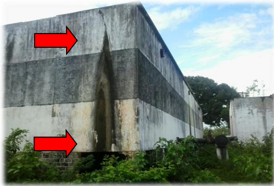
Figura 2 Percolação existente

O Reservatório em questão apresenta uma série de trincas que necessitam ser recuperadas para eliminar as perdas já hoje registradas e a contínua degradação da estrutura o que, eventualmente, poderá coloca-la em risco. As fotos a seguir mostram os pontos mais evidentes onde será necessária a intervenção: