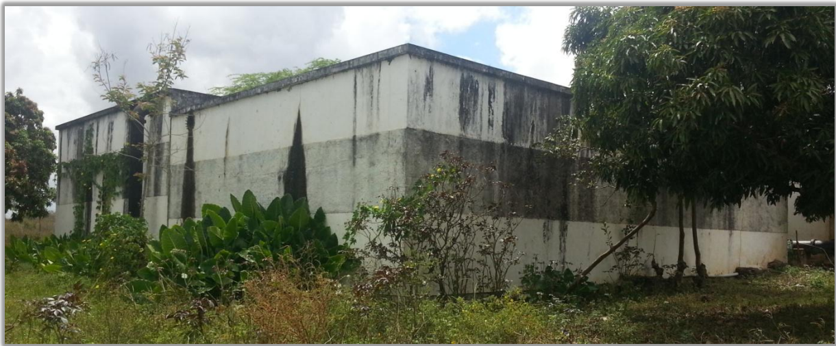
Figura 1: Vista do Reservatório do Povoado de Mota

A estrutura de concreto armado que compõem o reservatório apresenta várias trincas, e forte percolação em sua base, expondo a ferragem à oxidação e possibilitando crescente vazamento da água nele contida.